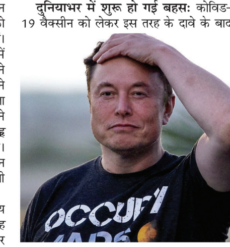
दुनियाभर में शुरू हो गई बहस: कोविड-19 वैक्सीन को लेकर इस तरह के दावे के बाद पूरी दुनिया में इसको लेकर बहस शुरू हो गई। बता दें कि इस बात का दावा करने वाले डॉ. हेल्मुट स्टर्ज ने दशकों टॉक्सिकोलॉजी के क्षेत्र में काम किया है। इसमें पता लगाया जाता है कि कोई वस्तु कैसे इंसानों या फिर अन्य जीवों को प्रभावित करती है।

वाशिंगटन, एजेंसी। कोरोना काल के दौरान जिस वैक्सीन को लेकर होड़ लगी हुई थी उसी को लेकर कई तरह के उदावने दावे भी किए जाते हैं। कोविड वैक्सीन को लेकर दावे करने वालों में अब एलन मस्क का भी नाम जुड़ गया है। उन्होंने कहा कि कोविड-19 वैक्सीन का दूसरा डोज लेने पर उन्हें लगा कि जैसे यह उन्हें मार ही देगी। बता दें कि फाइजर के एक पूर्व टॉक्सिकोलॉजिस्ट ने जर्मनी की संसद में दावा किया था कि ड्रव्ह वैक्सीन को मंजूरी ही नहीं मिलनी चाहिए थी। उन्होंने दावा किया कि इस कोविड-19 वैक्सीन की वजह से जर्मनी में हजारों लोगों की जान चली गई। अमेरिकी बायोफार्मा कंपनी फाइजर के यूरोपीय सेंटर के पूर्व टॉक्सिकोलॉजी हेड ने भी इसी तरह का दावा किया कि इतिहास में सबसे बड़े स्तर पर इस्तेमाल की गई वैक्सीन बेहद खतरनाक है। इसका एक वीडियो सोशल मीडिया पर सामने आया। पिछले सप्ताह इसे करोड़ों लोगों ने देखा। मस्क ने कहा कि इतने बड़े दावे को भी खबरों में हाइलाइट नहीं किया गया।