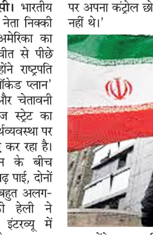
उन्होंने उपराष्ट्रपति जेडी वेंस के बातचीत खत्म करने के फैसले का समर्थन करते हुए कहा, 'हम बातचीत जारी नहीं रखेंगे। यह हमारे समय के लायक नहीं है। ट्रंप

वाशिंगटन , एजेंसी। भारतीय मूल की रिपब्लिकन नेता निक्की हेली ने कहा कि अमेरिका का ईरान के साथ बातचीत से पीछे हटना सही था। उन्होंने राष्ट्रपति डोनाल्ड ट्रंप के 'ब्लॉकैड प्लान' का समर्थन किया और चेतावनी दी कि तेहरान होमुंज स्ट्रेट का इस्तेमाल वैश्विक अर्थव्यवस्था पर दबाव बनाने के लिए कर रहा है। अमेरिका और ईरान के बीच बातचीत अग्रे नहीं बढ़ पाई, दोनों पक्षों के बीच वार्ता बहुत अलग-अलग थी। निक्की हेली ने सीएनएन को एक इंटरव्यू में बताया, 'अमेरिका के पास 15 प्वाइंट का प्लान था। ईरान के पास 10 प्वाइंट का प्लान था। वे सच में मीलों दूर थे। ईरानी अपना न्यूक्लियर प्रोडक्शन और होमुंज