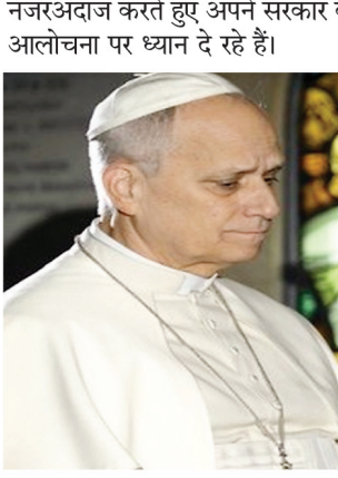
ट्रंप ने लिखा, 'पोप मेरी सरकार के 'डर' की बात तो करते हैं, लेकिन वो उस डर के बारे में कुछ नहीं बोलते जो कोरोना के समय चर्च में झेला था। उस वक्त चर्च में प्रार्थना सभा आयोजित करने के लिए पादरियों और अन्य लोगों

वाशिंगटन , एजेंसी। ईरान के साथ संघर्ष और पाकिस्तान में आयोजित बातचीत विफल होने के बाद पोप लियो एक्सआइवी ने अमेरिका के राष्ट्रपति डोनाल्ड ट्रंप की कड़ी आलोचना की। इसके बाद अमेरिकी राष्ट्रपति ने एक लंबे सोशल मीडिया पोस्ट में पोप पर तीखा पलटवार किया। ट्रंप ने उन पर अपराध रोकने में 'दिलीर' बताने का आरोप लगाया। साथ ही, उन्होंने विदेश नीति, ईरान और अमेरिका के परेल्डू मुद्दों पर पोप के विचारों की कड़ी आलोचना भी की। ट्रंप ने अपने ट्वीट सोशल प्लेटफॉर्म पर लिखा, 'पोप लियो अपराध के मामले में कमजोर हैं और विदेश नीति के लिए बहुत बुरे हैं।' इससे न्हाइट हाउस और वेटिकन के बीच तनाव फिर से बढ़ गया। पोस्ट में, ट्रंप ने पोप पर आरोप लगाया कि वे कोविड-19 महामारी के दौरान धार्मिक सभाओं पर लगी पिछली पाबंदियों को