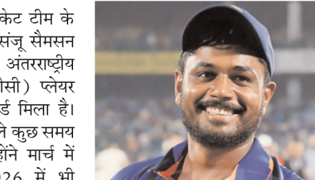
उन्होंने 89 रनों की पारी खेली थी।

दुबई । भारतीय क्रिकेट टीम के विकेटकीपर बल्लेबाज संजू सैमसन को मार्च महीने के लिए अंतरराष्ट्रीय क्रिकेट परिषद (आईसीसी) प्लेयर ऑफ द मंथ का अवार्ड मिला है। सैमसन का प्रदर्शन पिछले कुछ समय में शानदार रहा है। उन्होंने मार्च में टी20 विश्व कप 2026 में भी भारतीय टीम की जीत में महत्वपूर्ण भूमिका निभाई थी। सैमसन को पहली बार ये खिताब मिला है। सैमसन ने टी20 विश्वकप में लगातार तीन अर्धशतक लगाये थे। वेस्टइंडीज के खिलाफ प्लेऑफ में उन्होंने 97 रनों की शानदार पारी खेलकर भारतीय टीम को बड़े अंतर से जीत दिलायी थी। इसके बाद सेमीफाइनल में इंग्लैंड के खिलाफ 89 रन बनाए। वहीं फाइनल में न्यूजीलैंड के खिलाफ