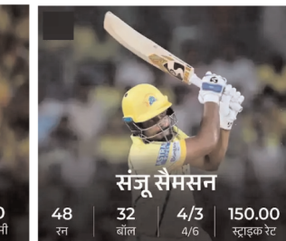
संजू सैमसन 48 रन 32 बॉल 4/3 150.00 स्ट्राइक रेट